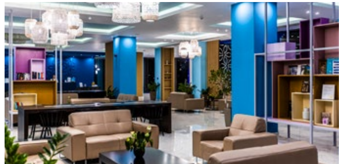
Lobby Lounge mit Bibliothek

* TrustYou ist globaler Marktführer unter den Reputations-Management-Anbietern und trägt die Hotelbewertungen aus unzähligen Bewertungskanälen und Social Media zusammen. Der TrustScore ist das Ergebnis aus allen vorhandenen Kommentaren und verifizierten Bewertungen. Damit sind die TrustScores deutlich aussagekräftiger als die Bewertungen aus einzelnen Portalen. Die TrustScores sind wie folgt aufgeteilt: 86-100 (Ausgezeichnet) | 80-85 (Sehr gut) | 75-79 (Gut) | 68-74 (Mittelmäßig) | 0-67 (Schlecht)