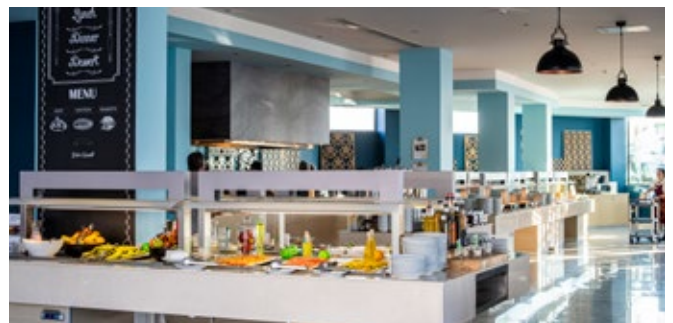
Restaurant mit Brasserie-Konzept